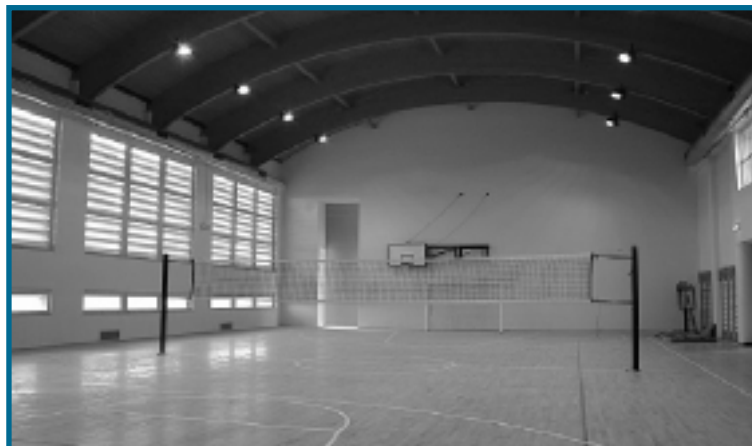
La nuova palestra scolastica

• Riqualificazione del Parco della Rocca con un progetto organico e significativo (fondi Gal e Legge speciale), giochi ed attrezzature di arredo: si è