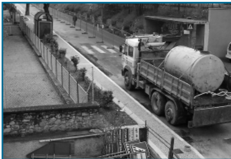
Il marciapiede che va da Porta Romana a Cappuccini

Un investimento complessivo di circa 80 milioni di euro in otto anni.