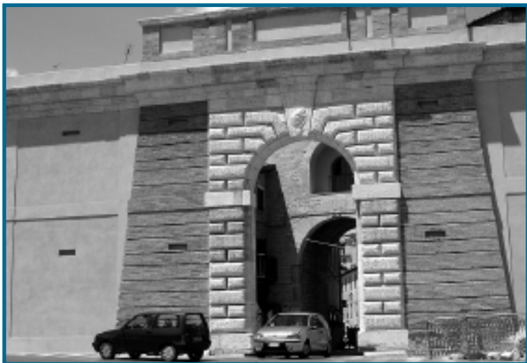
Piano Urbano Complesso di Porta Romana

Il governo del territorio ha rappresentato il filo conduttore della politica di programmazione e di bilancio del Comune, attraverso una visione d'insieme del Comune: centro storico, quartieri e frazioni . Inoltre si è tenuto conto di alcune specificità: le aree industriali, lo spazio rurale ed agricolo, le aree di dissesto idrogeologico , quelle protette e di tutela ambientale .