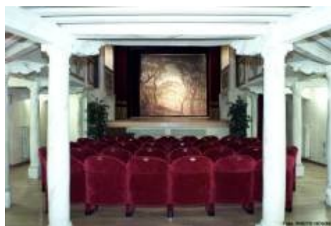
Il teatro più piccolo del mondo The smallest theatre in the world