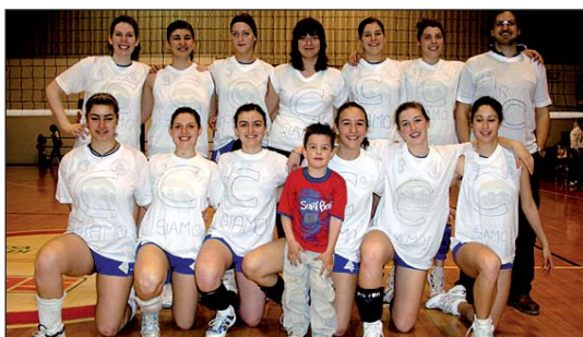
Le neopromosse in serie C della Samer