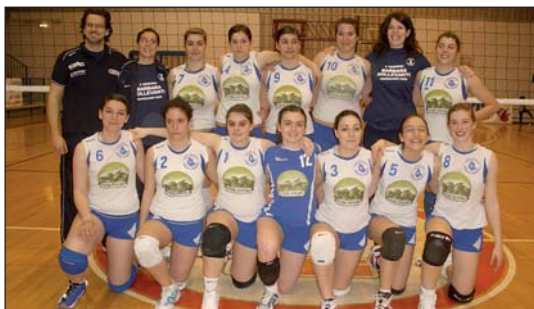
Le ragazze dell'Under 16