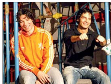
Marco Bocci e Francesco Venditti a teatro (Non lo dico a nessuno).

Marco Bocci (Boccolini all'anagrafe) rimane il bravo ragazzo di sempre. Non perde occasione per tornare a casa, per la felicità di papà Marcello e mamma Graziella. «La mia vita è qui con i miei familiari e miei amici di sempre». Non lo dice per farsi bello. È così. La vocazione di attore l'aveva dentro da sempre, ma ha scoperto che poteva provarci dopo aver partecipato al Laboratorio teatrale diretto dalla Strata e da De Virgili.