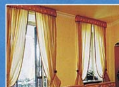
Tende da interno