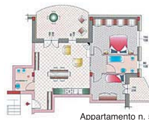
Appartamento n. 5

CENTRO ITALIA COSTRUZIONI GENERALI S.r.l.