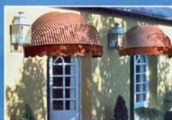
Tende da esterno