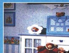
Carta da parati