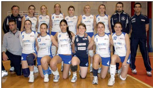
La formazione della Ecomet