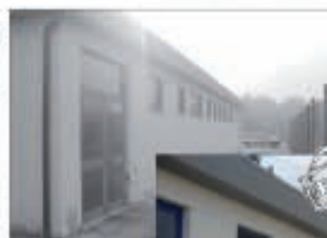
Adeguamento e consolidamento Palazzina Servizi - Ponte Naia