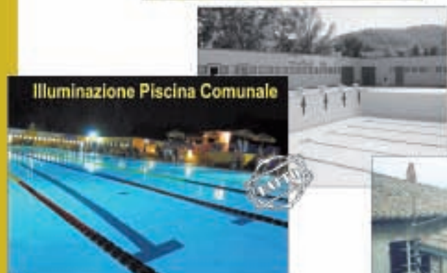
Illuminazione Piscina Comunale