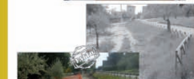
Area verde di Torregentile