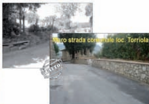
Maro strada comunale loc. Torriola

Dopo un anno di intenso lavoro, conoscitivo, progettuale e fattivo, l'Amministrazione comunale è lieta di porre all'attenzione dei Cittadini i primi concreti risultati cui siamo giunti. Al di là di tante parole, che rischiano di essere percepite come auto-celebriative, è nostra convinzione che sia opportuno raccontare nei fatti, attraverso queste foto, quanto operato sul territorio tuderte. Le immagini documentano gli interventi per la realizzazione di strutture sportive, la sistemazione di importanti vie di accesso alla città e alle frazioni. Strategicamente rilevante è il completamento dell'ingresso della zona Industriale di Ponterio - Pian di Porto, la quale, nei giorni scorsi, ha visto la definizione dell'accordo che ne consentirà finalmente un pieno e completo sviluppo. Particolare impegno è stato dedicato alle aree giochi per bambini, con la messa a norma delle esistenti e la realizzazione di nuove laddove non ancora presenti. Sono state ampliate alcune aree cimiteriali e sistemate numerose problematiche strutturali delle stesse. Oltre alle opere visibili, sono in cantiere ulteriori interventi e lavori pubblici su cui tutti sarete costantemente aggiornati. È allo studio un innovativo piano annuale delle Opere Pubbliche, che a breve sarà formalmente presentato, con il quale l'Amministrazione intende dare una svolta alla valorizzazione della città e delle sue frazioni, in un'ottica tesa ad attuare una nuova e concreta crescita di Todì e del territorio.