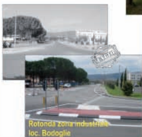
Rotonda zona industriale loc. Bodoglie