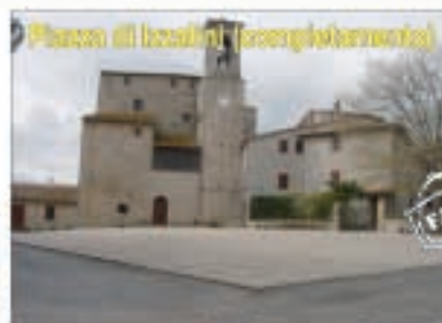
Piazza di località (completamento)