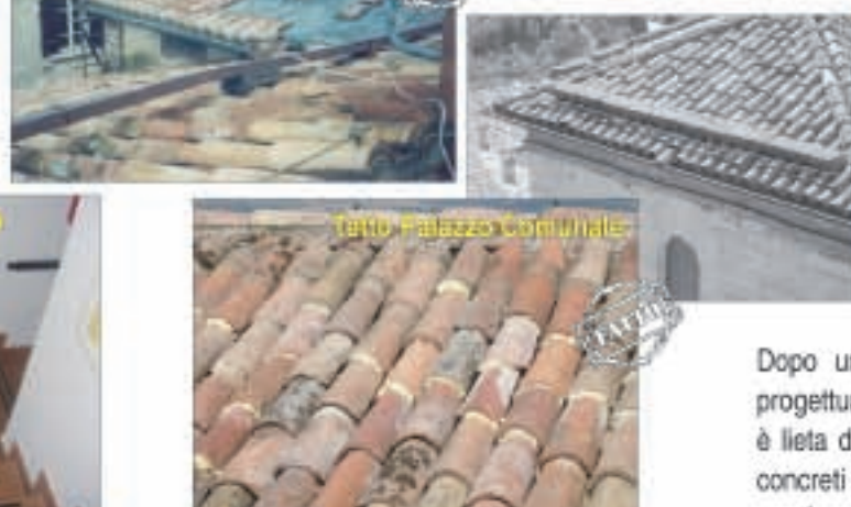
Tetto Palazzo Comunale