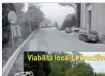
Viabilità località Casalecchio