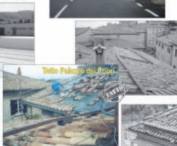
Tetto Palazzo dei Priori