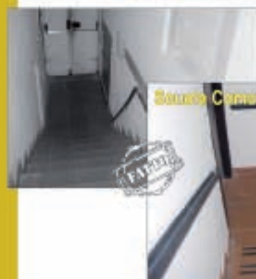
Banco Comunale di Musica