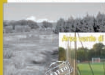
Area verde di Collespinosa