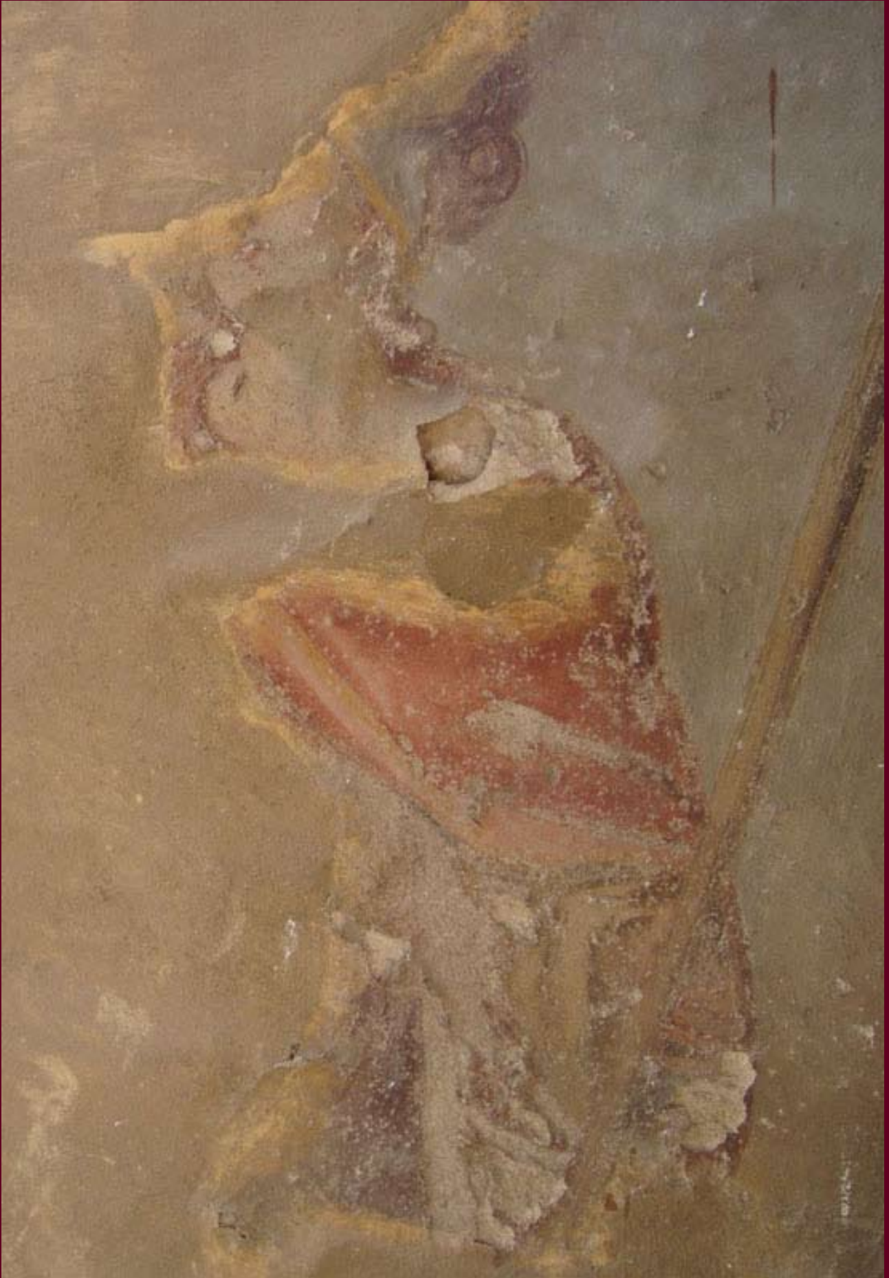
PRIMA DEL RESTAURO