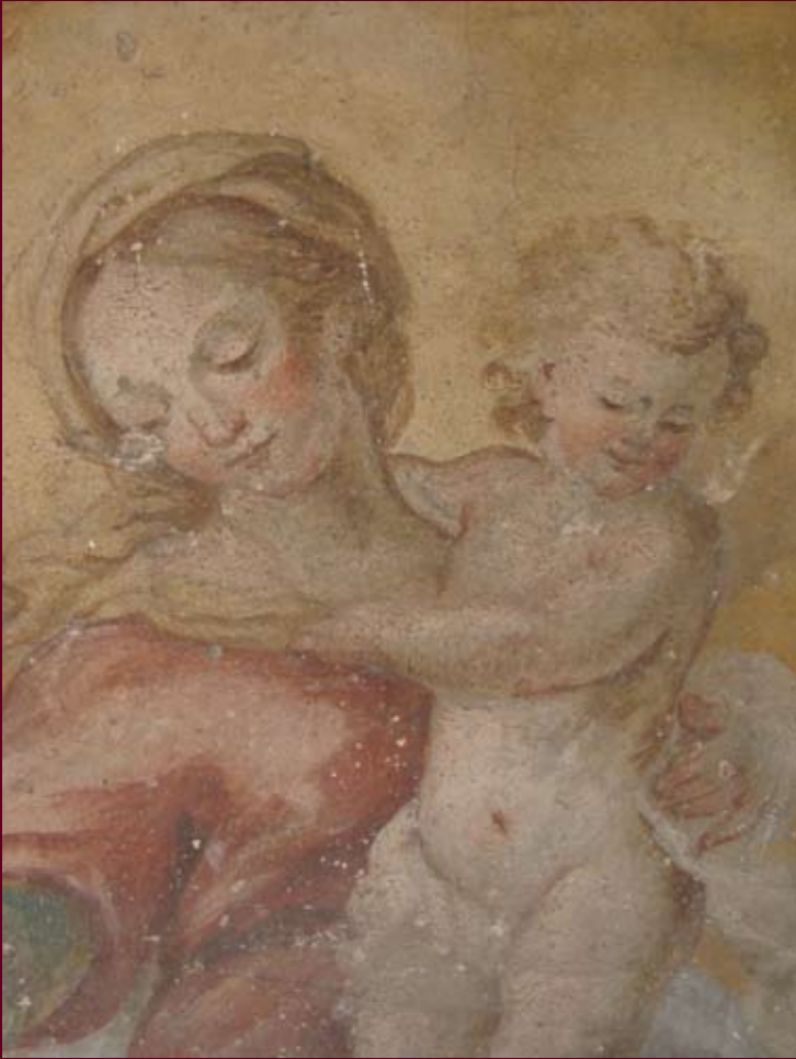
PRIMA DEL RESTAURO DOPO IL RESTAURO