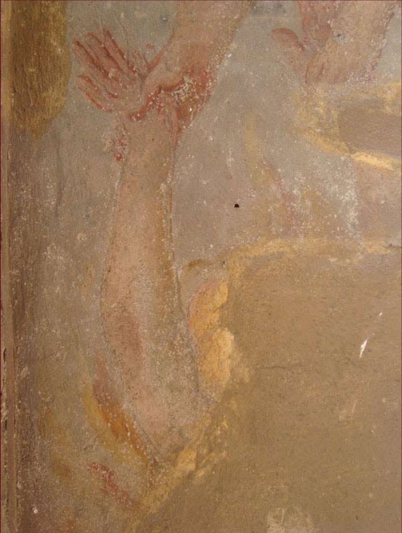
PRIMA DEL RESTAURO