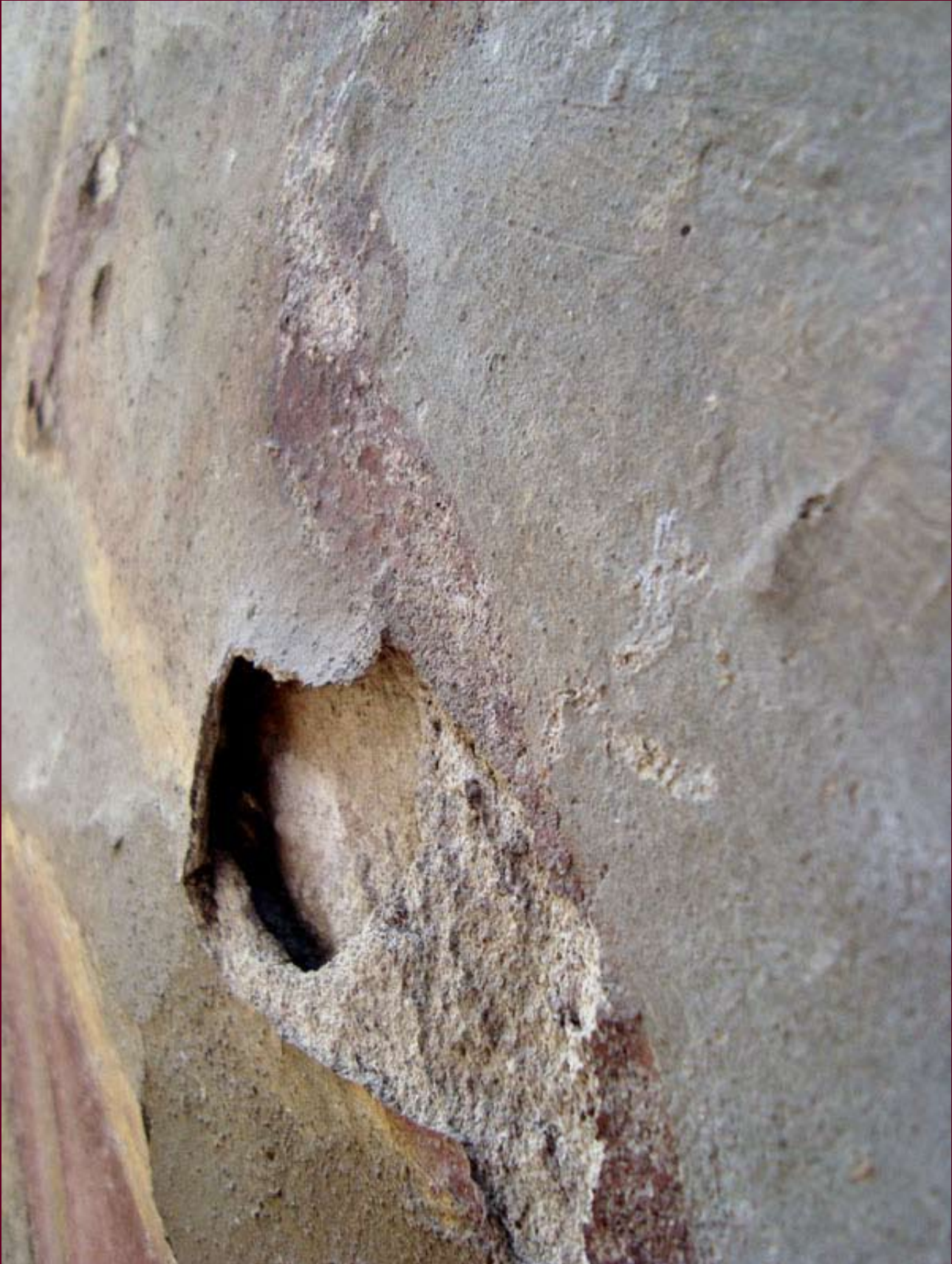
DISTACCHI DEGLI INTONACI PRIMA DEL RESTAURO