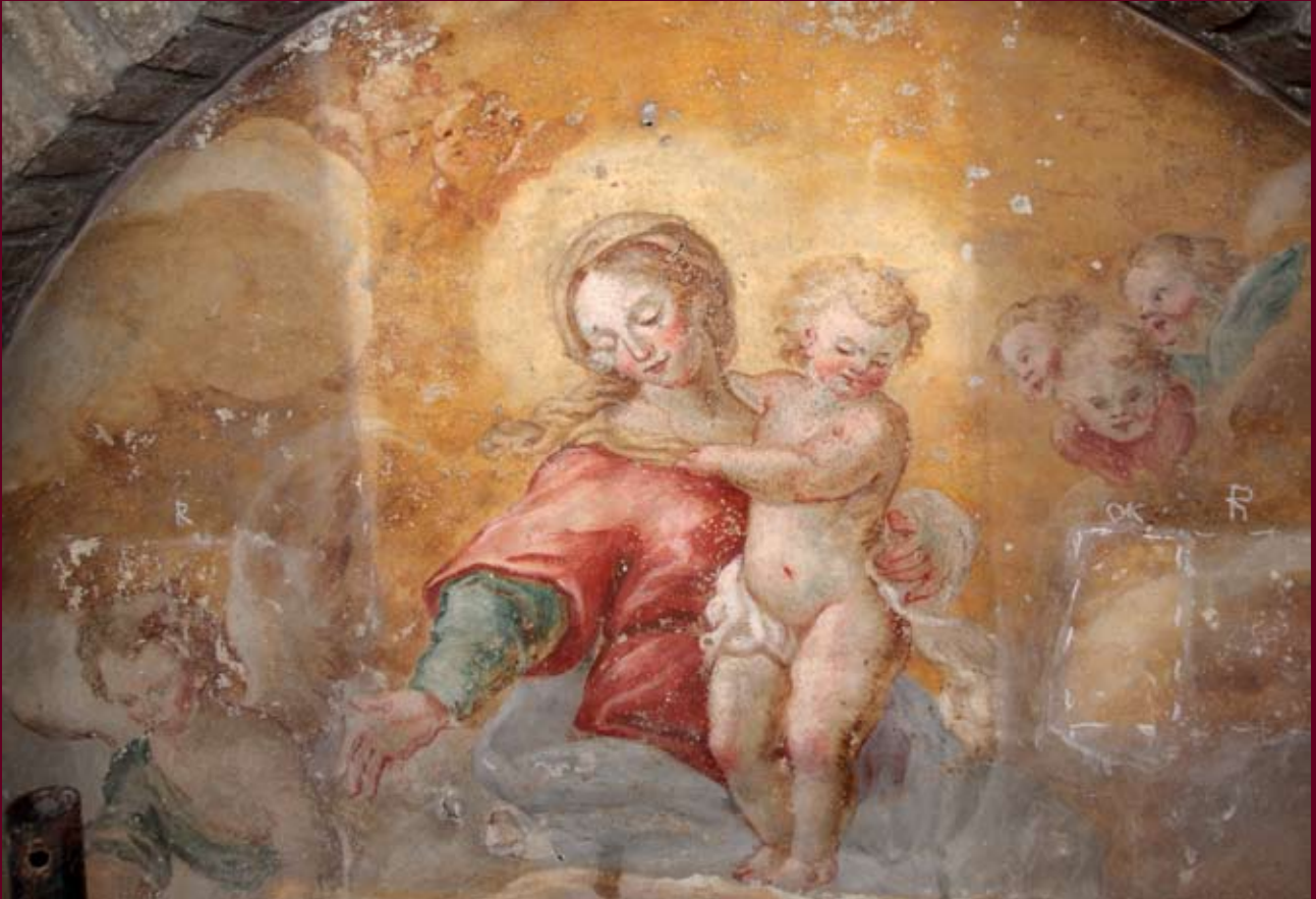
SAGGI DI PULITURA