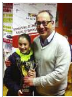
La manifestazione è anche il risultato scaturito dal fatto che il Tennis Club Todi 1971 è

Gli incontri si sono disputati in 4 week-end (venerdì/sabato e domenica), con le finali che si sono giocate sabato 8 e domenica 9 marzo.