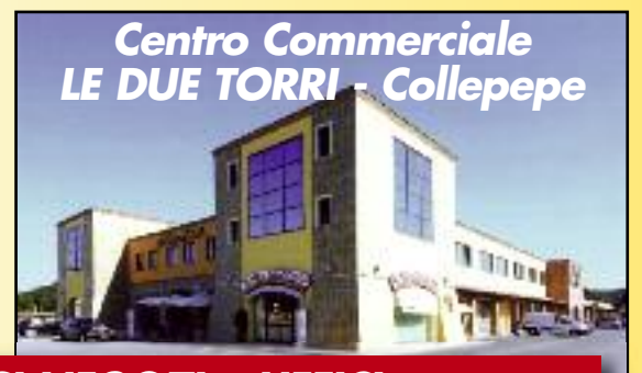
Centro Commerciale LE DUE TORRI - Collepepe

VENDESI NEGOZI e UFFICI di diverse tipologie - Possibilità di personalizzazione