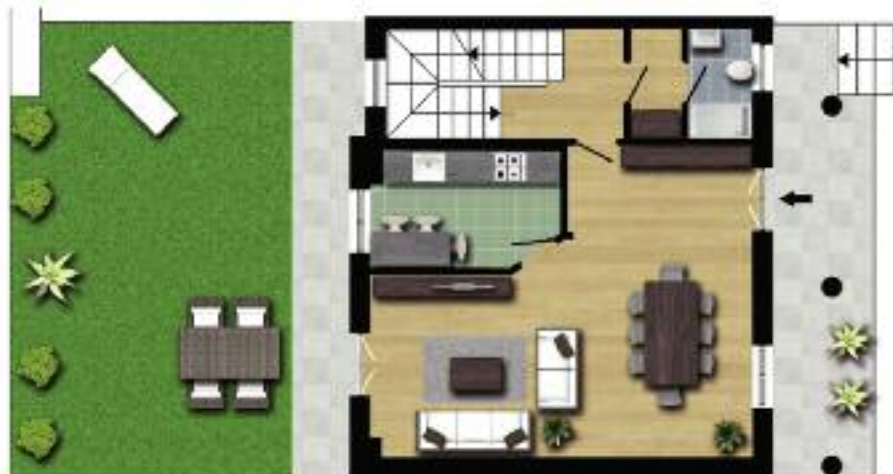
Piano terra BIFAMILIARE "B"