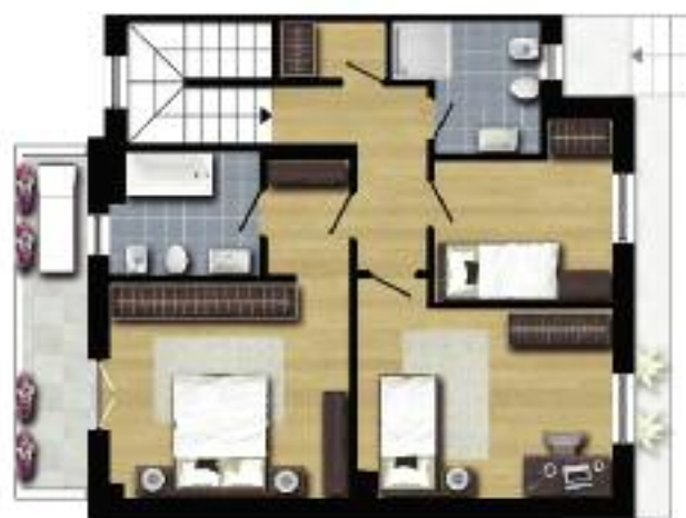
Piano primo BIFAMILIARE "B"