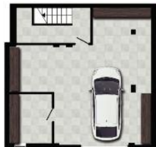
Piano seminterrato BIFAMILIARE "B"

CANTIERE APERTO tutti i GIOVEDI' POMERIGGIO dalle 14:00 alle 19:00 con i nostri agenti