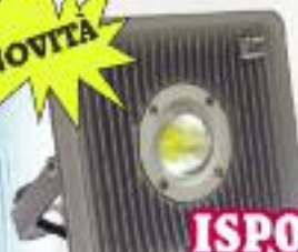
ISPO PROIETTORI LED