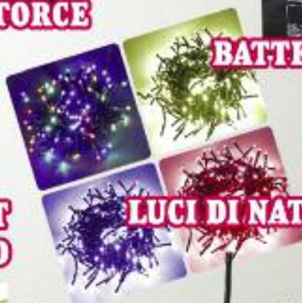
LUCI DI NATALE