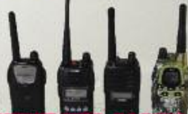
RADIOLINE USO CACCIA